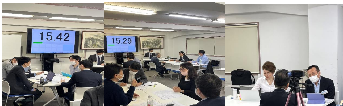
写真：ロールプレイの様子