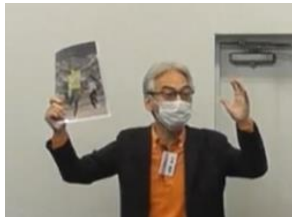
写真：ミニプレゼンテーションの様子