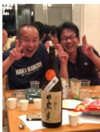
写真：懇親会の様子

懇親会は、稼プロ！特別講師・OB生のほかに、経営コンサルタント養成塾（同日・別会場にて講義を実施）の皆さんと合同で行い、おおいに盛会となりました。懇親会の凄い特徴は、毎年、差入れで日本全国の日本酒が集まるということです。これを目的に合宿を訪れるOB生も少なくありません。懇親会のしがり部隊が夢見心地の頃、朝一で行う「ののゆる体操」も定着しつつあります。この「ののゆる体操」は、【話す】の特別講義でご登壇いただいている宮崎先生が考案した体操で、