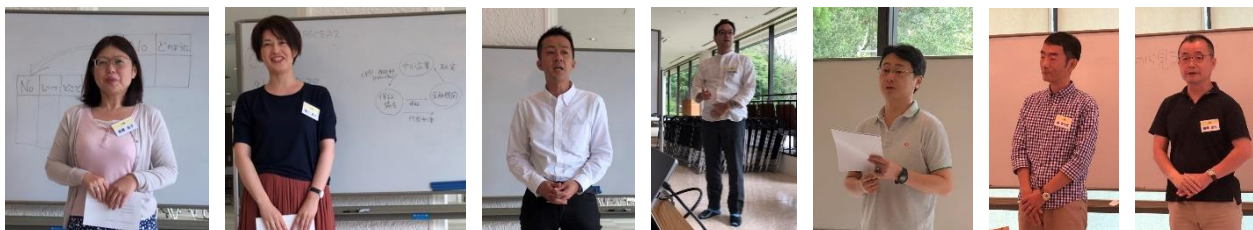
写真：プレゼンテーションの様子

「話す」プレゼンテーションは今回で3回目。3分間のプレゼンテーションの後にフィードバックを受けます。本人ではなかなか気づくことのできない、様々な観点からのフィードバックを得られるのが大きな特徴です。1日目に4名、2日目に3名がプレゼンテーションを行いました。3回目ともなると、他者がこれまでに受けた指摘が共有され、話の構成はもちろんのこと、姿勢、身振り手振り、視線の送り方など総合的にレベルが上がっています。ポイトレ特別企画に参加された方々は、声の出し方に早くも変化があるように感じました。