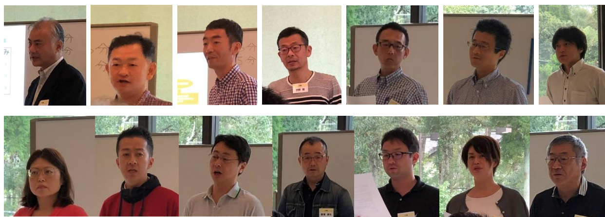
写真：キャリアビジョン発表の様子

翌日には塾生14名により、各自のキャリアビジョンを発表しました。これまで練りに練って作成したものですので、稼プロ!開始時とは比べ物にならないほど強い決意のほどが伺えます。しかし、塾長、運営スタッフからは、忌憚のないすどいコメントや質問があがりました。発表者はそれらに答えながら、さらに自分の行く道のイメージを膨らませる機会となったのではないのでしょうか。