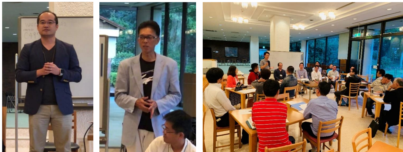
写真：プレゼンテーションの様子

キャリアビジョンのブラッシュアップでは、OB生の自己紹介であつという間に距離を縮めた後、OB生との座談会形式で活発な意見交換となりました。