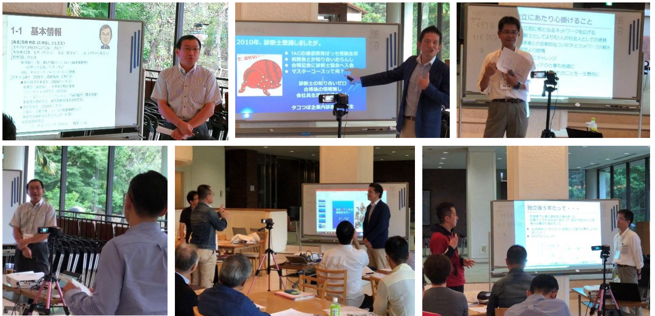
写真：ロールモデル紹介と質疑応答の様子

塾生はみな、それぞれの話に引き込まれ、質問タイムでは活発なやりとりが続きました。自分の今後は独立か、それとも企業内か2足のわらじか。どう自分の強みを明確にして販路を開拓するか。選択肢が広がる最新の診断士モデルの数々に触れ、塾生は大いに啓発されたのではないでしょうか。