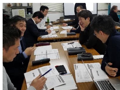
写真：ワークで意見交換する塾生とOB生