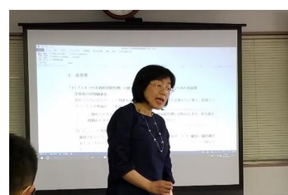
写真 3チームのプレゼンテーションコンテストの様子