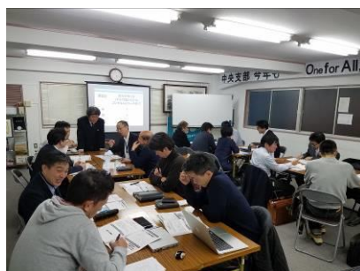
写真：OB生を含め総勢18名が受講する様子