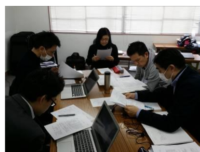
写真: 診断報告内容とプレゼンテーションをブラッシュアップする塾生と講師